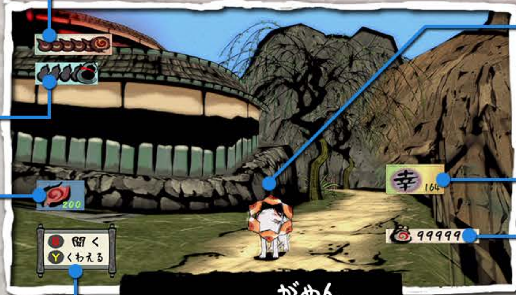
がめん プレイ画面