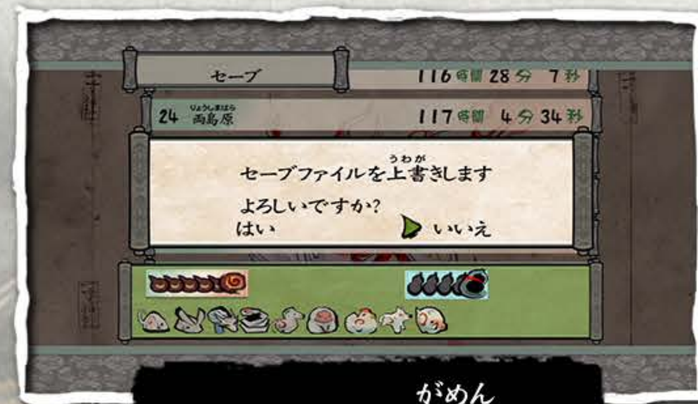
がめん セーブ画面

がめん せんたく タイトル画面のメニューで「つづきから」を選択し、 つづ おこな せんたく 続きを行いたいデータを選択することで、 ぜんかいきろく じょうたい ぼうけん つづ 前回記録した状態から冒険を続けることができます。 じょうほう うわが まえ きろく き ちゆうい ※情報を上書きすると、前の記録は消えてしまうので注意しましょう。