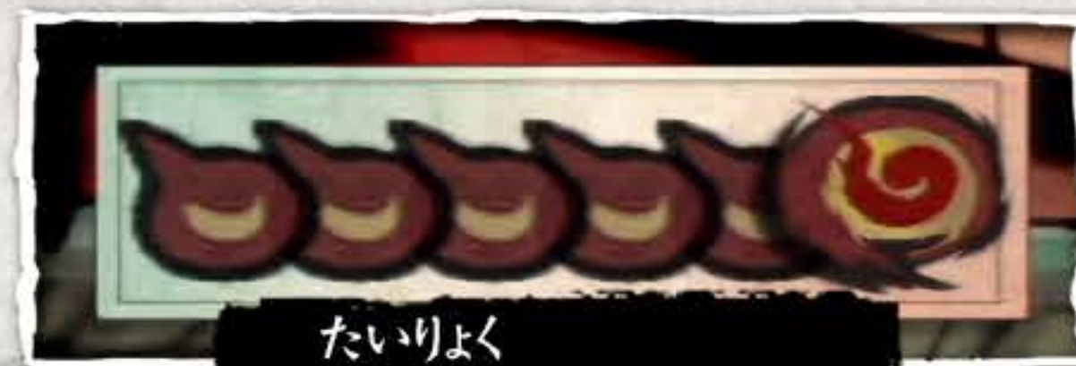
たいりよく 体カゲージ

プレイヤーの体力は画面左上の「太陽器」で確認できます。 ダメージを受け、太陽器が全てなくなるとゲームオーバーになります。