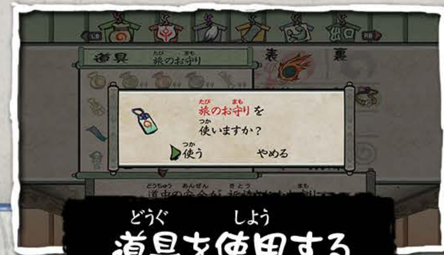
どうぐ しょう 道具を使用する

どうぐ とくしゅ のうりよく ひ ちから ぼうけん てだす 道具は、特殊な能力を秘めていてその力は冒険の手助けとなります。 たいはん いっかいいつか 大半のものは一回使うとなくなってしまうます。