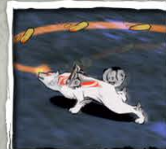
まがたま おもて 勾玉 (表)