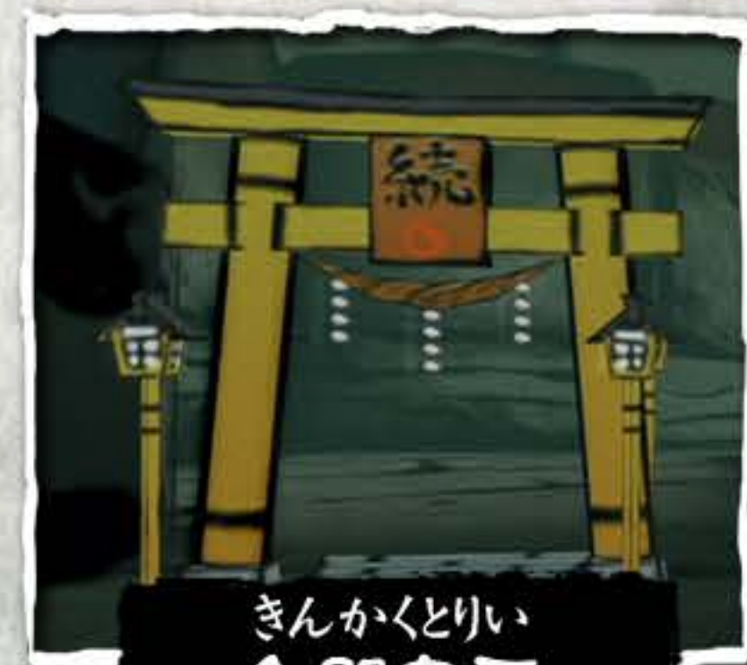
きんかくどりい 金閣鳥居