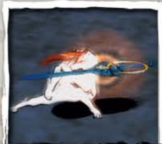
けん うら 剣 (裏)