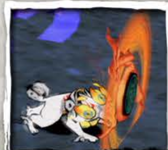
かがみ うら 鏡 (裏)