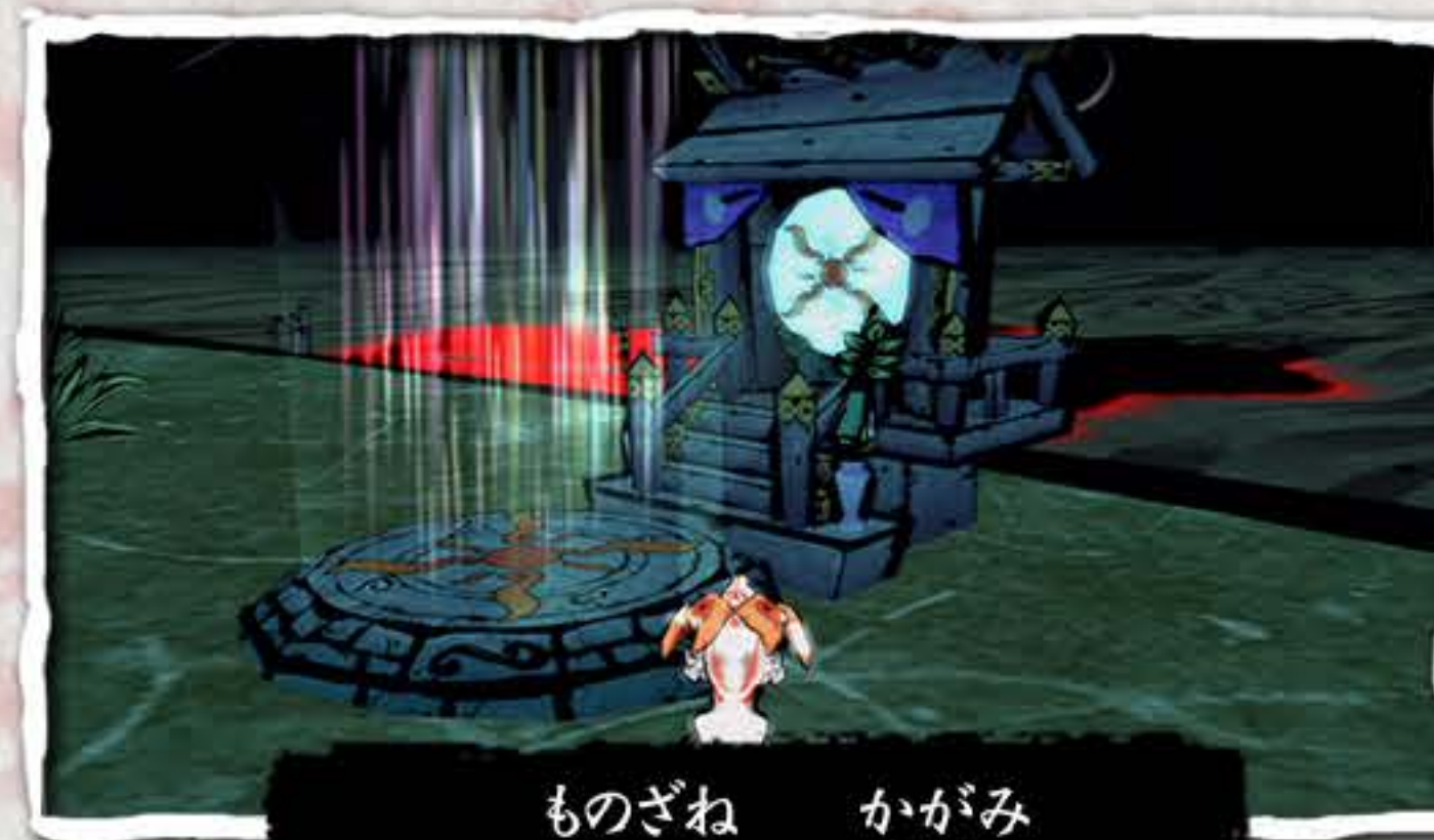
ものざね かがみ 物実の鏡

ものざね かがみ よ ばしょ ぼうけん きろく おこな こと 「物実の鏡」と呼ばれる場所で「冒険の記録」を行う事ができます。 ぼうけん きろく おこな ちゆうだん 「冒険の記録」を行わずにゲームを中断すると さいご ぼうけん きろく おこな じょうたい 最後に「冒険の記録」を行った状態から なお ちゆうい やり直しとなってしまいますのでご注意ください。