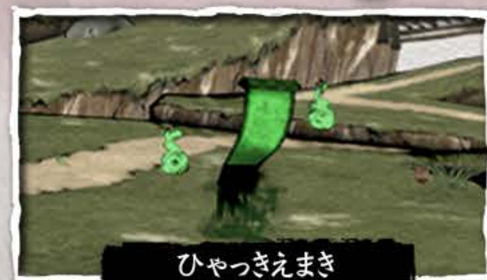
ひやつきえまき 百鬼絵巻

ぼうけん すす ひやつきえまき ふ 冒険を進めるうちに、「百鬼絵巻」に触れると けっかい なか せんとう おこな 「結界」の中で戦闘が行われます。