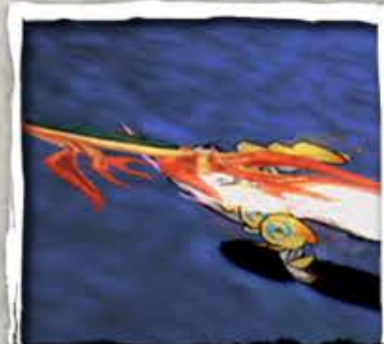
かがみ おもて 鏡 (表)