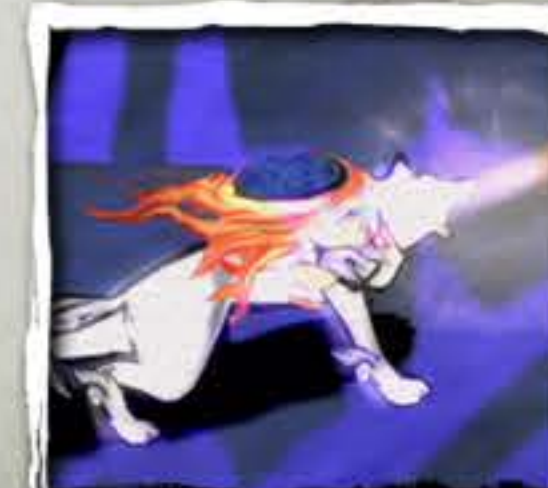
まがたま うら 勾玉 (裏)