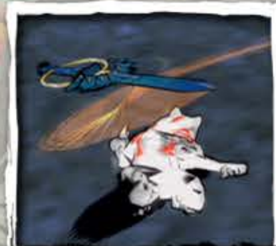
けん おもて 剣 (表)