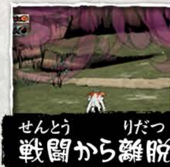
せんとう りだつ 戦闘から離脱