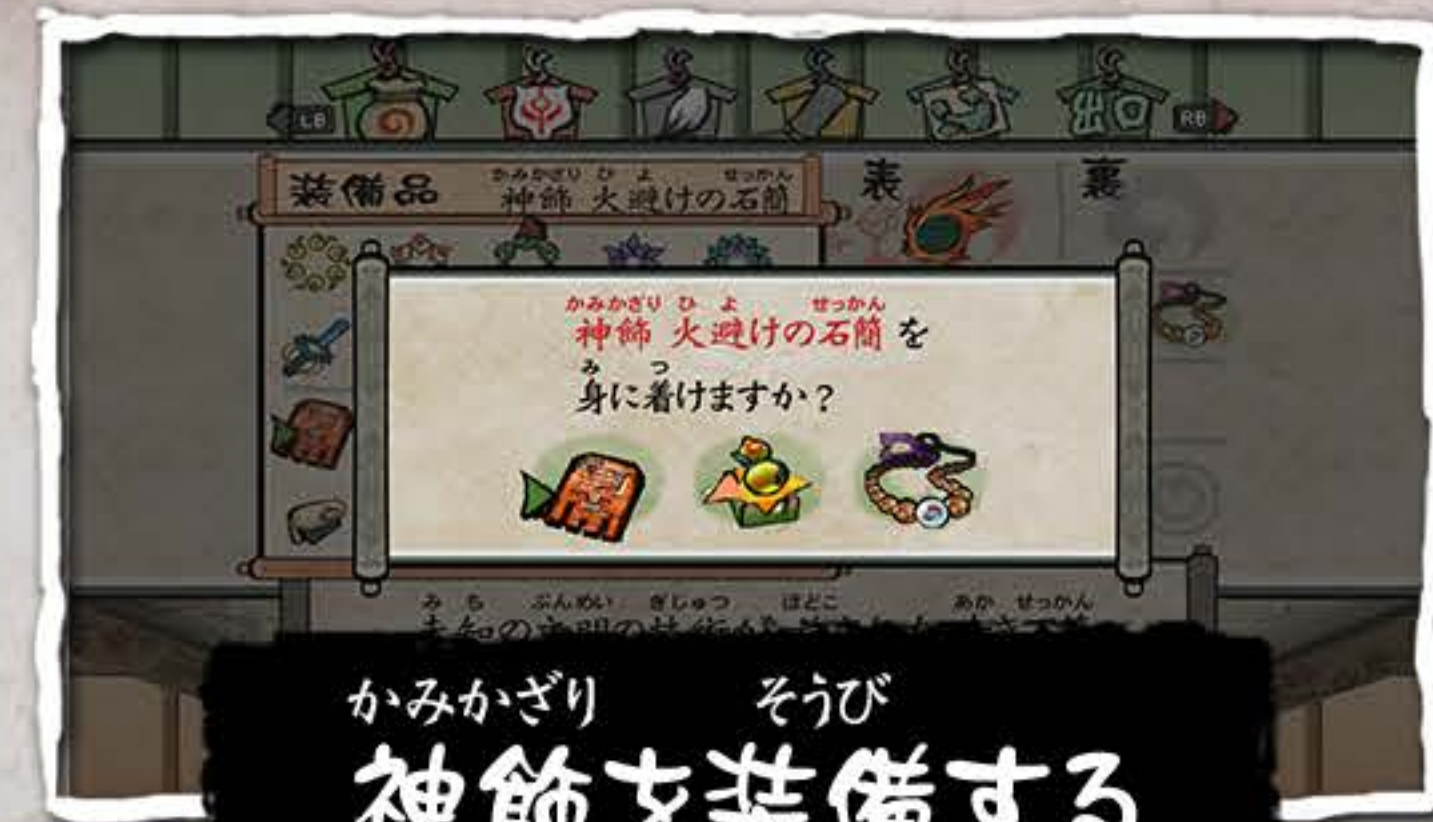
かみかざり そうび 神飾を装備する

とくしゅ のうりよく かいが ちから ひ 特殊な能力を開花させる力を秘めた、アクセサリです。 みつ そうび つうじょう こと のうりよく やど 三つまで装備でき、アマテラスに通常とは異なった「能力」が宿ります。 いま すす ばしょ い これによって今まで進めなかった場所へ行けるようになったりします。