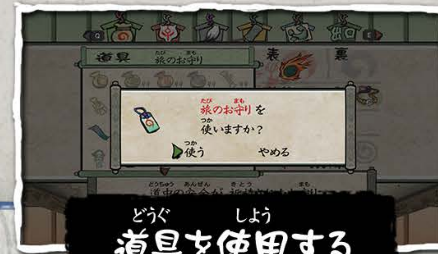
どうぐ しょう 道具を使用する

どうぐ とくしゅ のうりよく ひ ちから ぼうけん てだす 道具は、特殊な能力を秘めていてその力は冒険の手助けとなります。 たいはん いっかいいつか 大半のものは一回使うとなくなってしまうます。