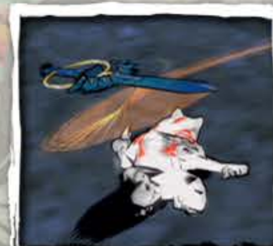
けん おもて 剣(表)