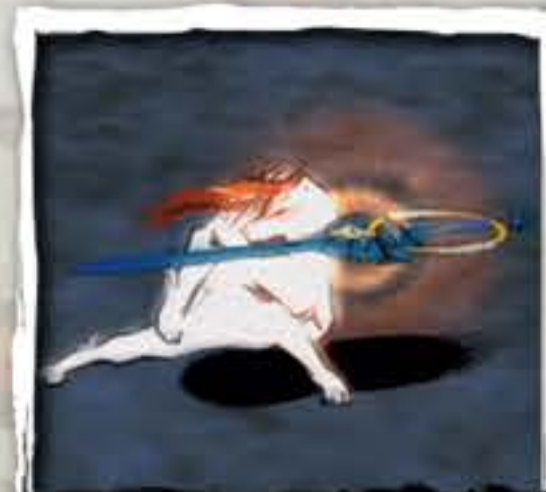
けん うら 剣(裏)