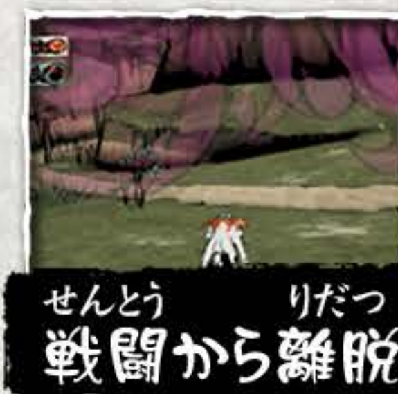
せんとう りだつ 戦闘から離脱