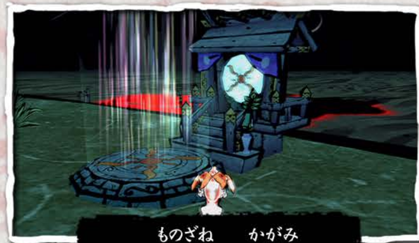
ものざね かがみ 物実の鏡

ものざね かがみ よ ばしょ ぼうけん きろく おこな こと 「物実の鏡」と呼ばれる場所で「冒険の記録」を行う事ができます。 ぼうけん きろく おこな ちゆうだん 「冒険の記録」を行わずにゲームを中断すると さいご ぼうけん きろく おこな じょうたい 最後に「冒険の記録」を行った状態から なお ちゆうい やり直しとなってしまいますのでご注意ください。