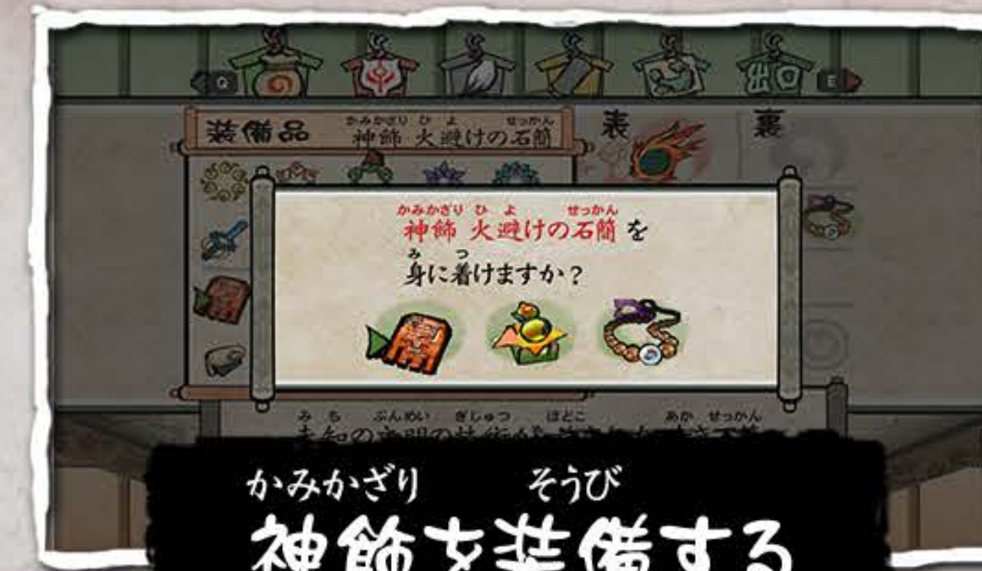
かみかざり そうび 神飾を装備する

とくしゅ のうりよく かいが ちから ひ 特殊な能力を開花させる力を秘めた、アクセサリです。 みっ そうび つうじょう こと のうりよく やど 三つまで装備でき、アマテラスに通常とは異なった「能力」が宿ります。 いま すす ばしょ い これによって今まで進めなかった場所へ行けるようになったりします。