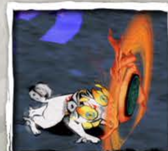
かがみ うら 鏡(裏)