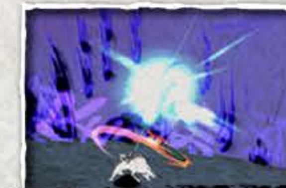
Greif den Riss an!

Hinweis: Ohne einen Riss, kannst du der Barriere nicht entkommen.