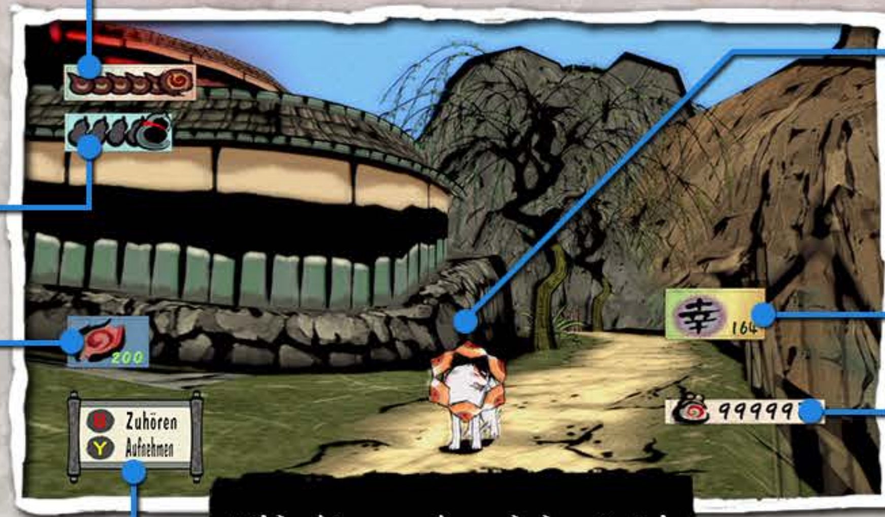
Bildschirm während des Spiels