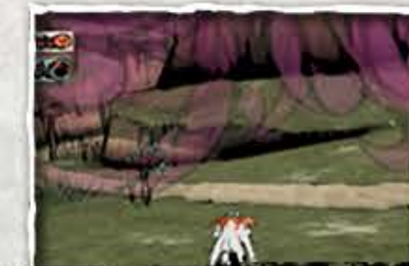
Entfliehe dem Kampf!